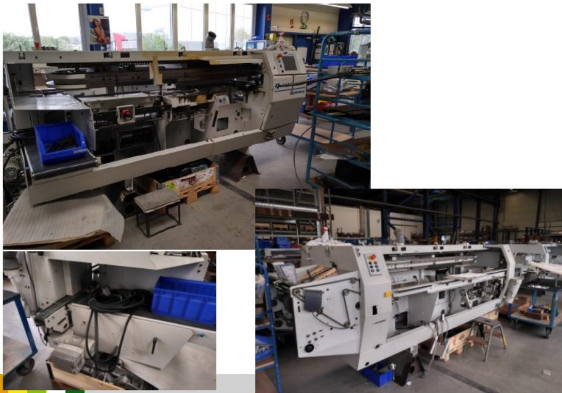
Ref: Folios Gráficos CM 202/2016 - Wohlenberg Publicaciones S.L.